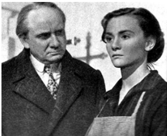
1952 LA JEUNE FOLLE d'Yves Allégret avec Danièle Delorme