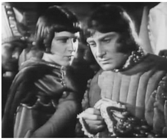
1927 LA MERVEILLEUSE VIE DE JEANNE D'ARC de Marc de Gastyne avec Simone Genevois