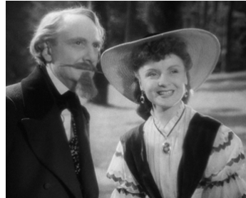
1942 LETTRES D'AMOUR de Claude Autant-Lara avec Odette Joyeux