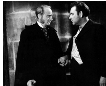
1945 ROGER LA HONTE d'André Cayatte avec Lucien Coëdel