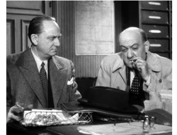
1952 OUVERT CONTRE X de Richard Pottier avec Yves Deniaud