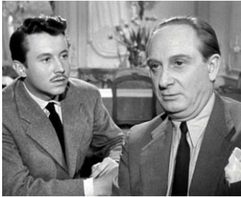
1950 JUSTICE EST FAITE d'André Cayatte avec Michel Auclair