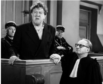
1951 LA POISON de Sacha Guitry avec Michel Simon