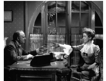
1953 MADAME DE... de Max Ophüls avec Danielle Darrieux