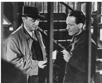
1946 LE VISITEUR de Jean Dréville avec Pierre Fresnay