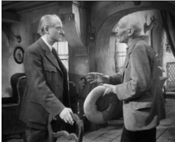
1942 LES AFFAIRES SONT LES AFFAIRES de Jean Dréville avec Marcel Loche