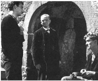
1948 LE CRIME DES JUSTES de Jean Gehret avec Jean-Marie Lambert