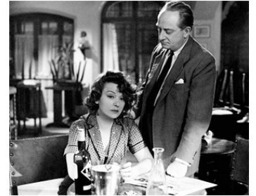
1951 LE CAP DE L'ESPÉRANCE de Raymond Bernard avec Edwige Feuillère