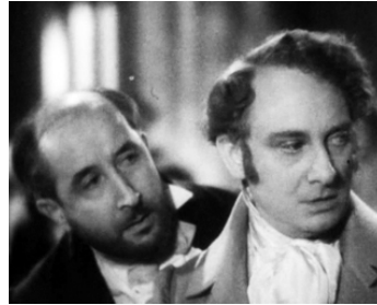
1936 UN GRAND AMOUR DE BEETHOVEN d'Abel Gance avec René Stern