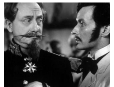
1948 D'HOMME À HOMMES de Christian-Jaque avec Jean-Louis Barrault