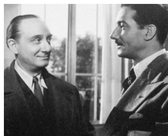
1947 CARREFOUR DU CRIME de Jean Sacha avec Louis Salou