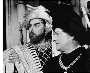
1951 BARBE-BLEUE de Christian-Jaque avec Pierre Brasseur