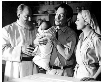
1952 IL EST MINUIT, DOCTEUR SCHWEITZER d'André Haguët avec Pierre Fresnay, J. Moreau