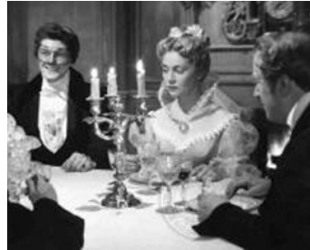
1951 NEZ-DE-CUIR d'Yves Allégret avec Jean Marais, Françoise Christophe