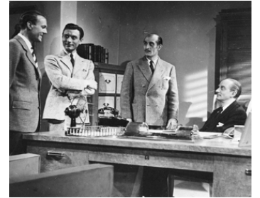
1942 DERNIER ATOUT de Jacques Becker avec Raymond Rouleau, Noël Roquevert