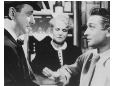
1945 SON DERNIER RÔLE de Jean Gourguet avec Marcel Dalio