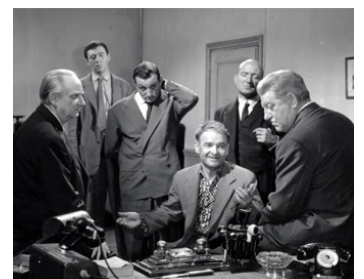
1957 MAIGRET TEND UN PIÈGE de J. Delannoy avec L. Ventura, Guy Decomble, Jean Gabin