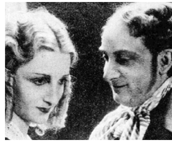
1933 LE GENDRE DE MONSIEUR POIRIER de Marcel Pagnol avec Annie Ducaux