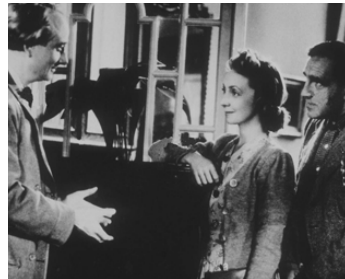
1945 LE CIEL EST À VOUS de Jean Grémillon avec Madeleine Renaud, Charles Vanel