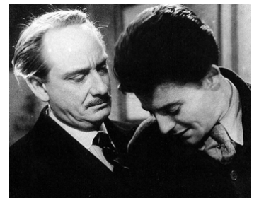
1947 LE DIABLE AU CORPS de Claude Autant-Lara avec Gérard Philipe