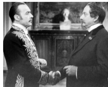
1954 NANA de Christian-Jaque avec Charles Boyer