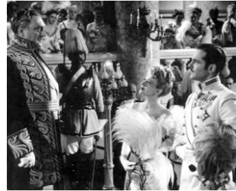
1939 DE MAYERLING À SARAJEVO de Max Ophüls avec Edwige Feuillère, John Lodge