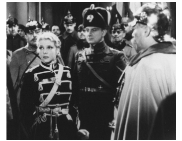
1935 KOENIGSMARK de Maurice Tourneur avec Elissa Landi