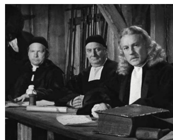
1956 LES SORCIÈRES DE SALEM de R. Rouleau avec Yves Bainville, Raymond Rouleau