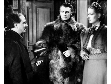
1943 DOUCE de Claude Autant-Lara avec Roger Pigaut, Madeleine Robinson