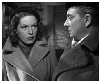
1946 LE FUGITIF de Robert Bibal avec Madeleine Robinson